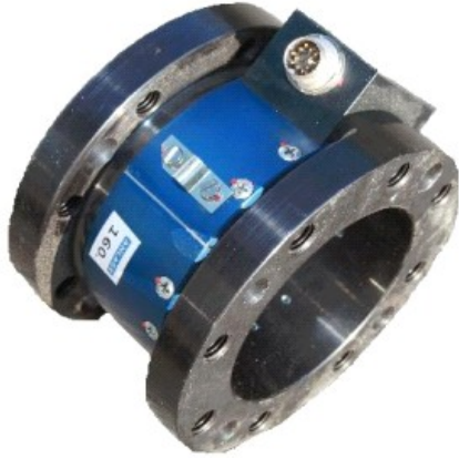
statisch dynamischer Drehmomentsensor